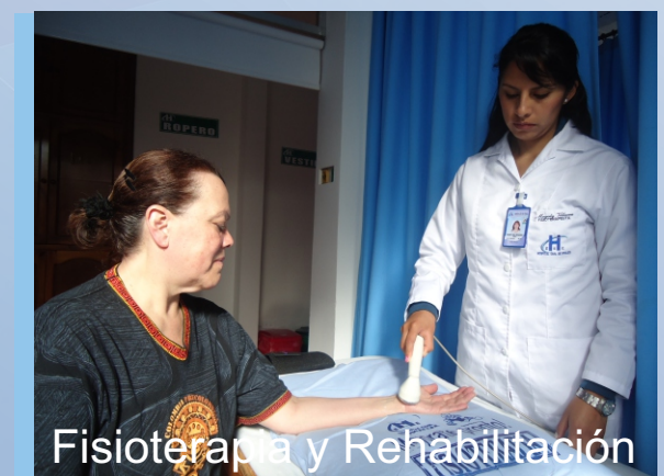
Fisioterapia y Rehabilitación