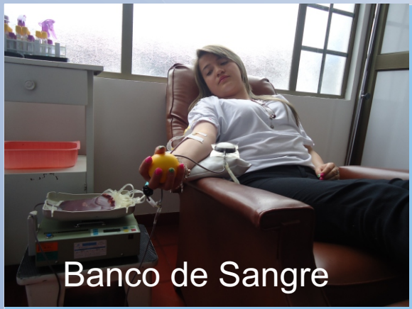
Banco de Sangre