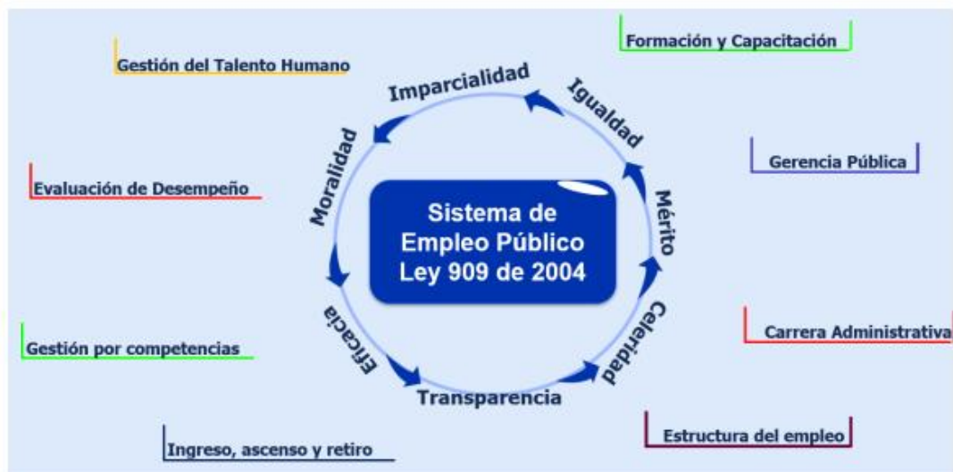
Figura 2. Sistema de Empleo Público en Colombia.